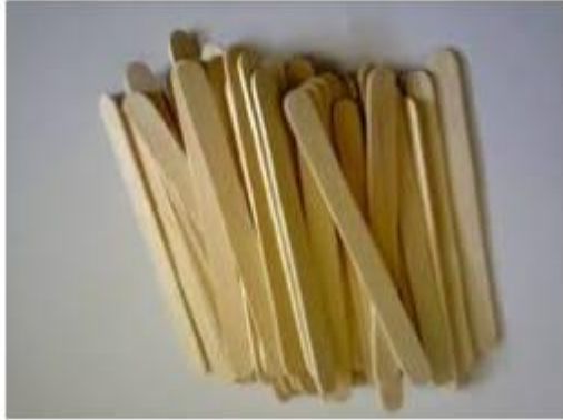
Stik es krim