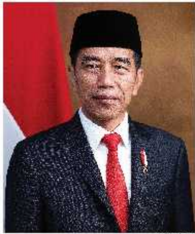
Ir. Joko Widodo Presiden Republik Indonesia (presidenri.go.id)