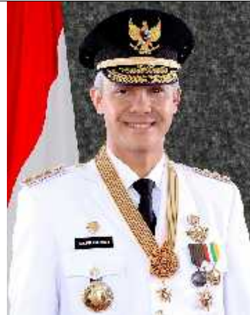
Ganjar Pranowo, S.H., M.I.P Gubernur Jawa Tengah