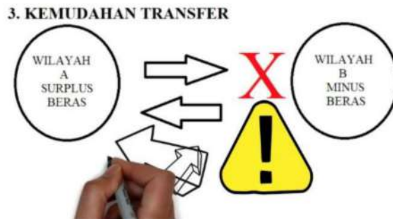
Gambar 18. Kemudahan transfer