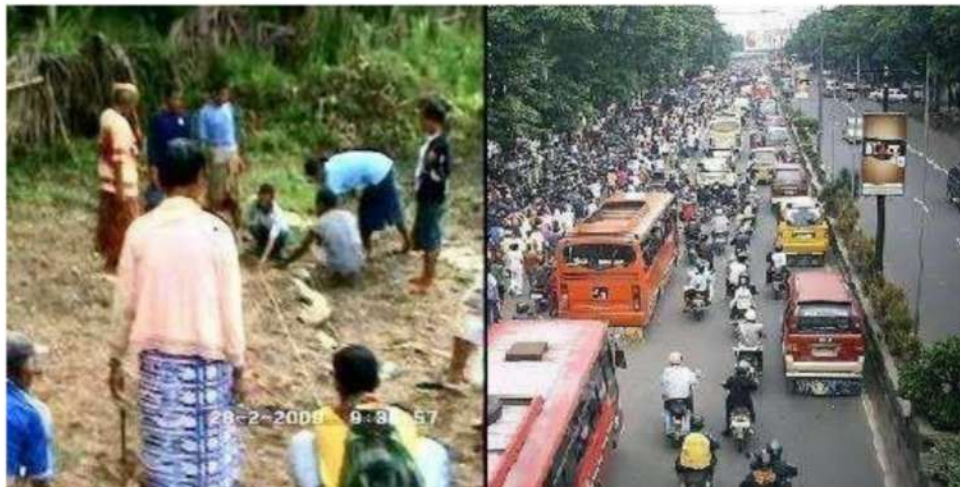
Gambar 15. Kehidupan kota dan kehidupan desa

Interaksi manusia dan lingkungannya berlangsung melalui dua cara. Pertama, manusia dipengaruhi oleh lingkungan. Kedua, manusia memiliki kemampuan untuk mengubah lingkungan. Karakteristik interaksi tersebut berbeda antara satu daerah dan daerah lainnya atau satu masyarakat dan masyarakat lainnya.