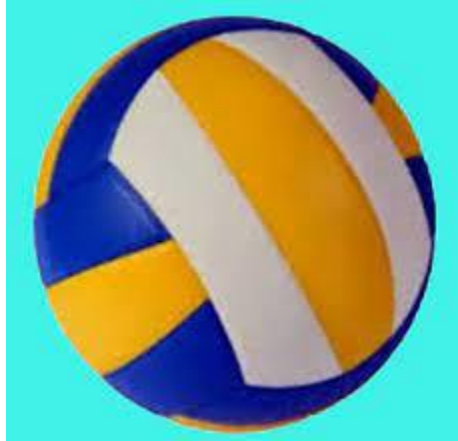
Gambar 2. Bola Ukuran 4

Sedangkan untuk bola yang digunakan dalam permainan bola voli mini dengan berat 230-250 gram atau bola voli yang berukuran 4