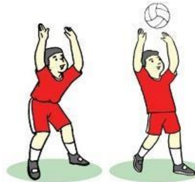
Gambar 4. Gerak dasar passing atas bola voli