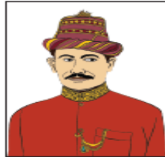
Sultan Iskandar Muda