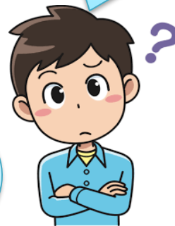
Kewajiban dan Hak di Sekolah