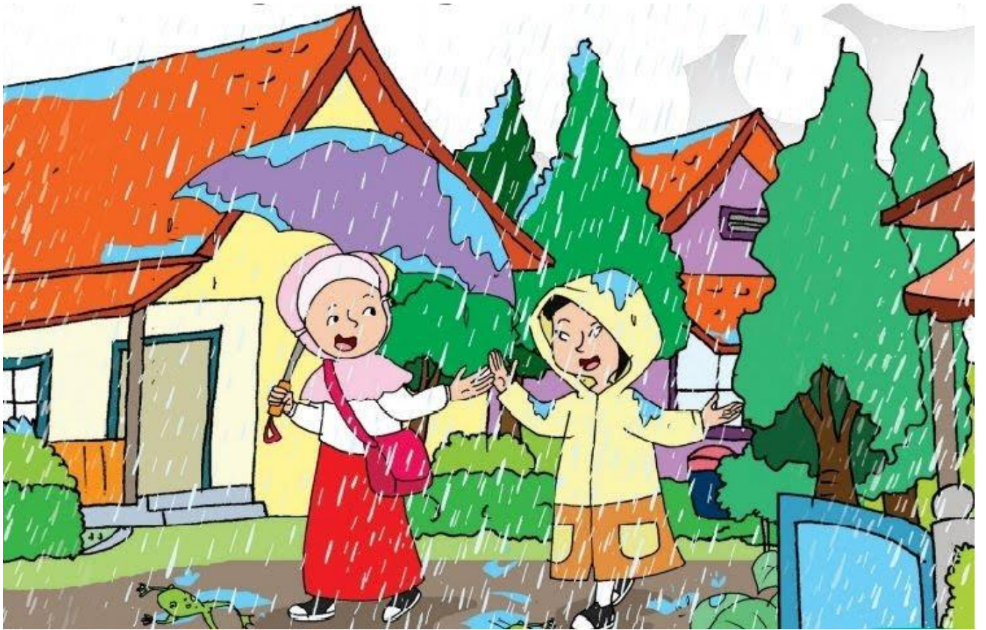
Gambar Musim Penghujan