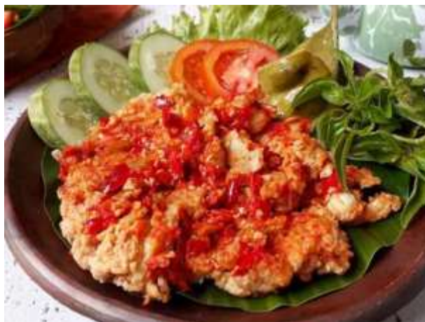
Resep ayam geprek rumahan

Ayam geprek mempunyai cita rasa yang gurih. Daging ayam yang dibalut dengan tepung bumbu yang renyah, lalu digeprek bersama sambal pedas membuatnya semakin