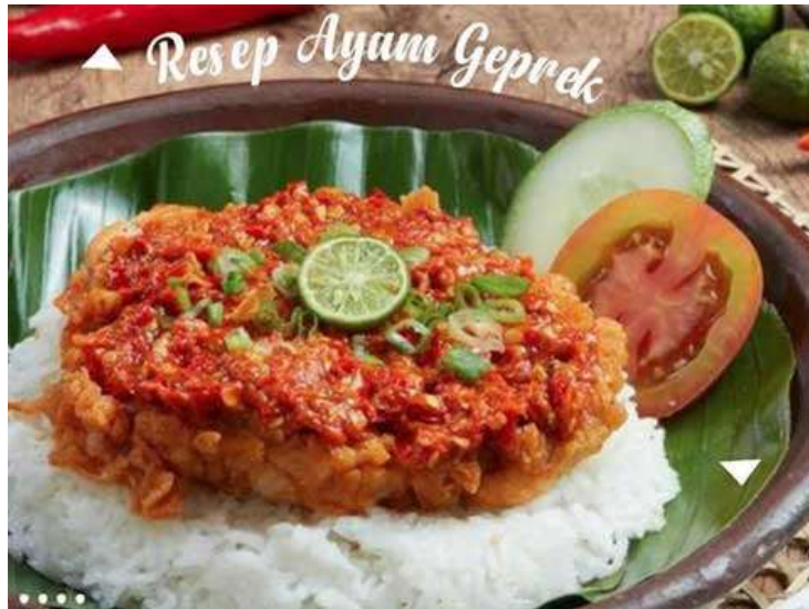
Ayam Geprek