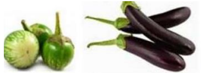
ERONG BULAT TERONG UNGU