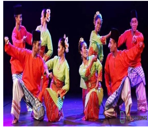
Gambar 4. Motif gerak tari Melayu