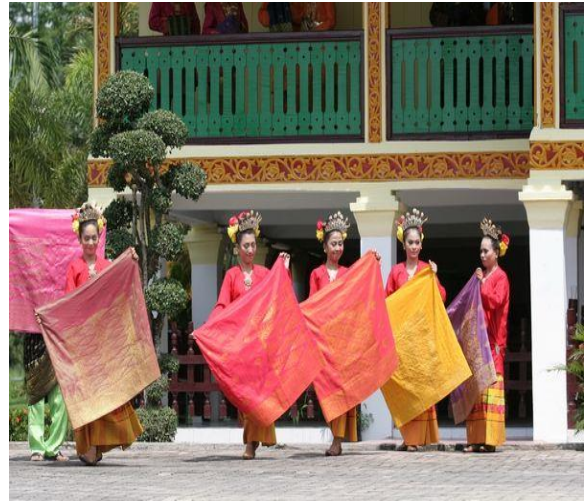
Gambar 2. Motif gerak tari Tenun Songket