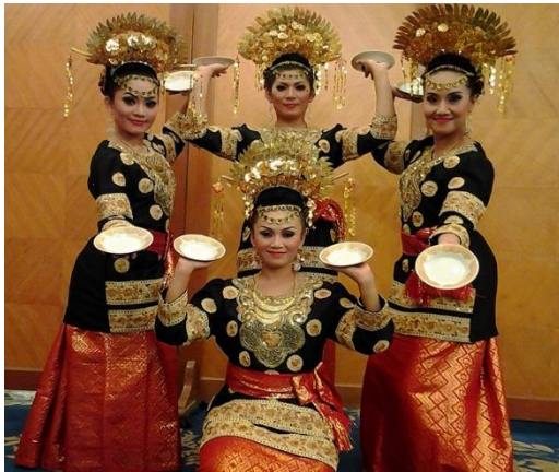
Gambar 3. Motif gerak tari Piring