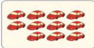
Mobil-mobilan ada 11