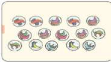
Kelereng ada 15