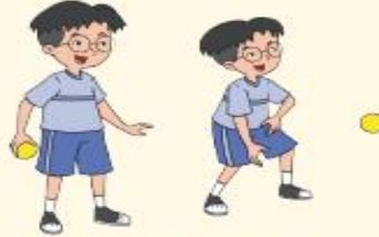
Melempar ke atas