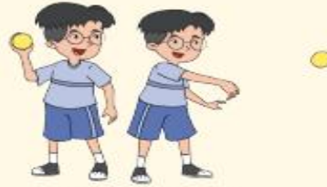
Melempar ke bawah