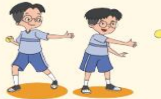
Melempar ke samping