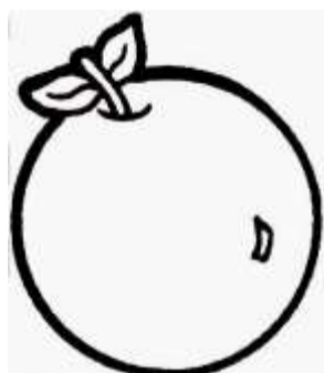
Pola Gambar Jeruk