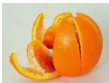
Media Audio Visual