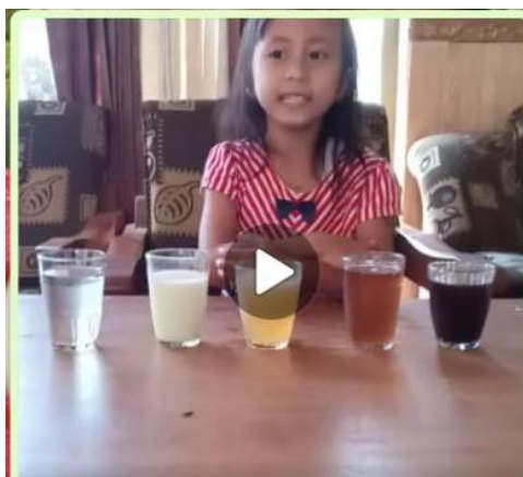
(Video anak menyebutkan 5 jenis minuman)