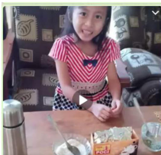
(video anak membuat teh)