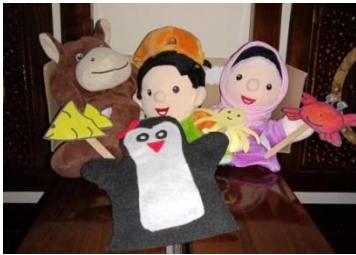
Boneka hasil karya