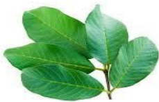
daun jambu biji

1. Anak mengamati macam-macam daun menurut bentuknya yang ada disekitar rumah ( Saintifik )