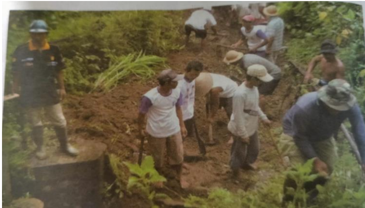
Gambar 3.2. Kegiatan padat karya