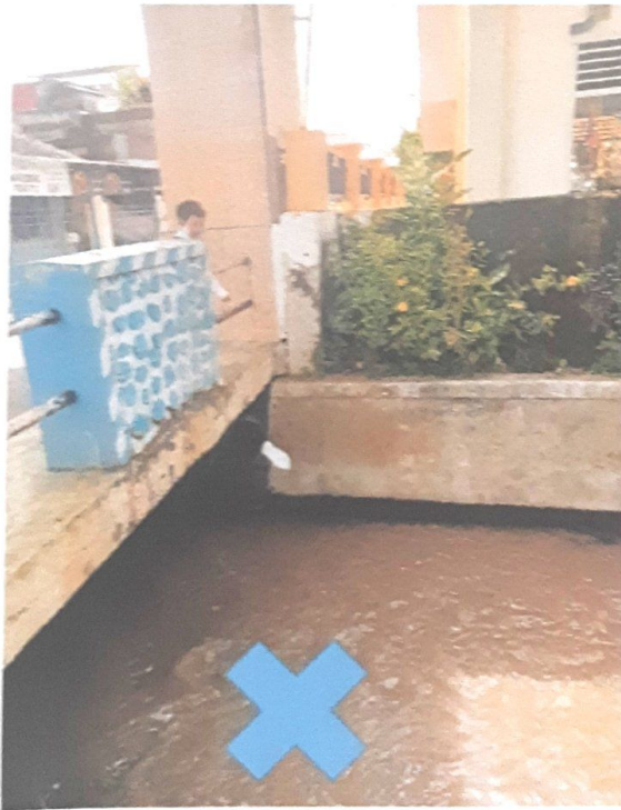
TIDAK BOLEH MEMBUANG SAMPAH DI SUNGAI