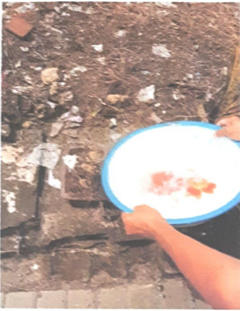
MENYIRAM TANAMAN DENGAN BEKAS CUCIAN BERAS