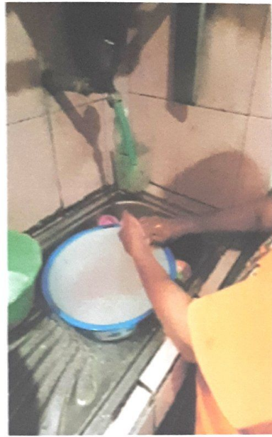
MEMATIKAN KRAN KETIKA MENYABUN