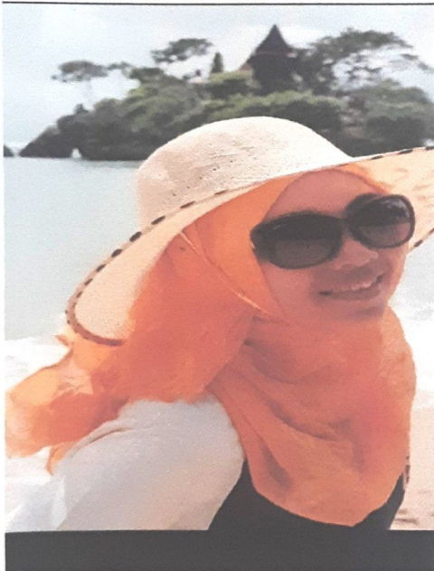
KACA MATA HITAM DAN TOPI