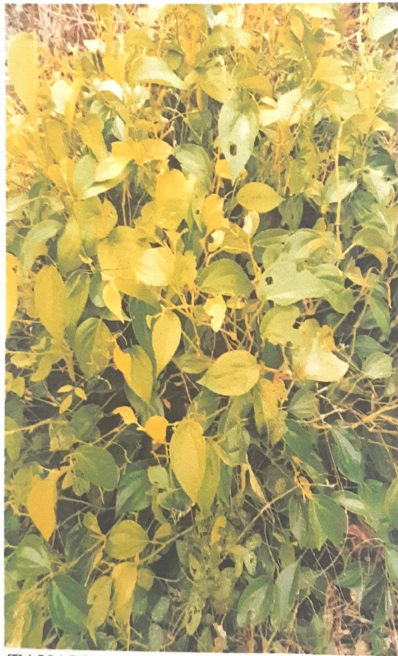
TANAMAN TUMBUH SUBUR