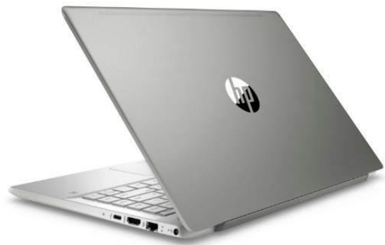
Alat komunikasi modern (HP, laptop, dll)