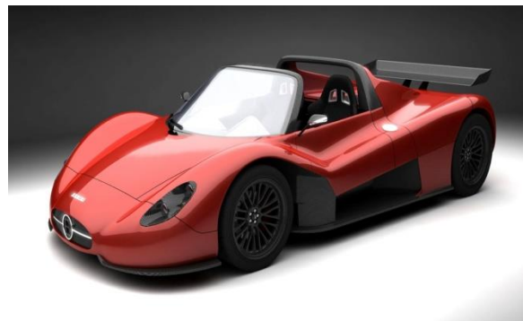
Alat transportasi modern (pesawat, mobil, dll)