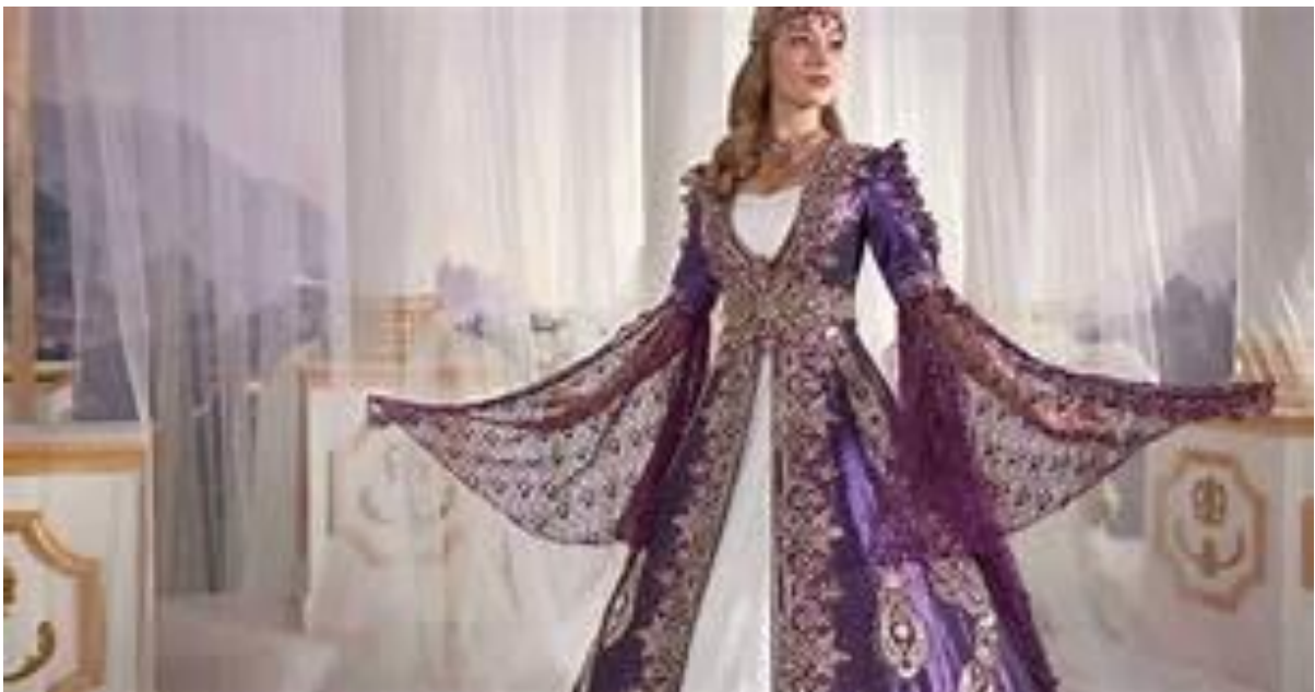
Pakaian modern (gaun)