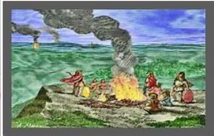
Alat komunikasi tradisional (kentongan, asap)