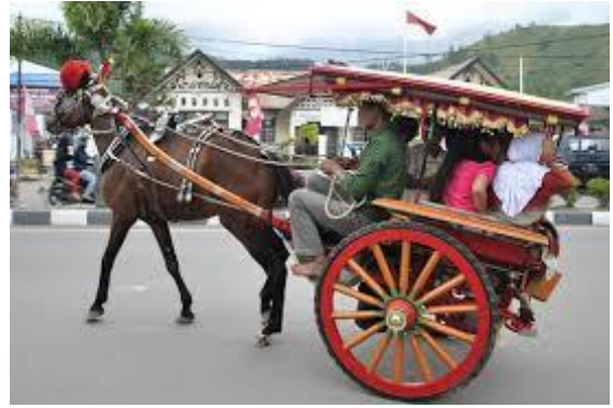
Alat transportasi tradisional (perahu, delman, dll)