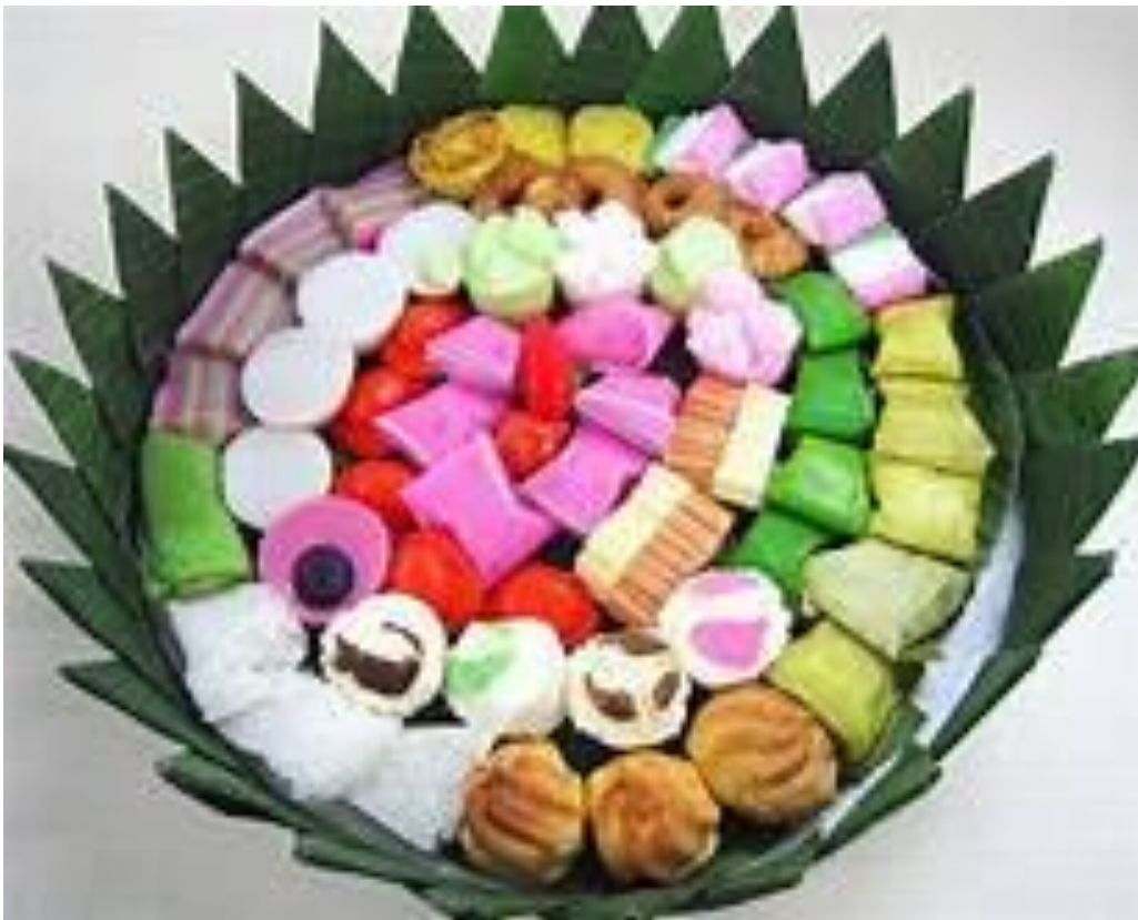
Makanan tradisional (getuk, lapis, tiwul, dll)