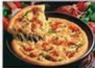
Makanan modern ( steak, burger, spagheti, piza)