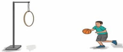
Gambar 1.12 Dribling dan shooting dengan simpai