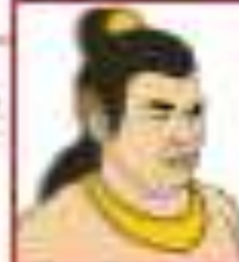
Mulyapati Gajay Madu dan Raja Hayam Wuruk, Kerajaan Majapahit