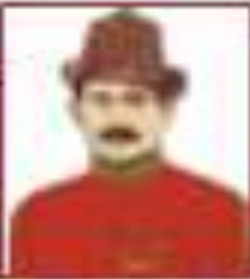
Sultan Iskandar Muda, Kerajaan Aceh, Aceh