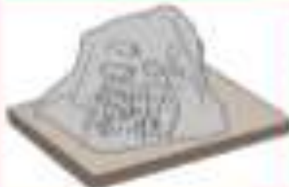
Prasasti Ciareun, peninggalan Kerajaan Tarumanegara, Bogor