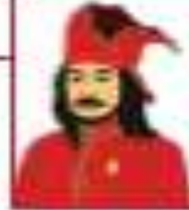
Sultan Hassanudin "Ayah Jantan dari Tiga" Kerajaan Gowa-Tallo, Makassar