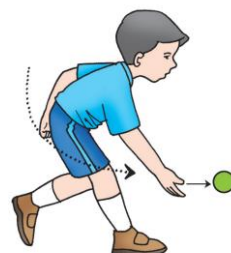
Gambar 1.8 Gerakan melempar bola bawah