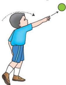
Gambar 1.6 Gerakan melempar bola melambung

Melempar bola dalam permainan kasti termasuk variasi gerak dasar manipulatif. Gerakan ini untuk mengumpan kepada pemain pemukul, mengoper kepada teman satu kelompok, atau mematikan kelompok pemukul. Pada permainan kasti, gerakan melempar bola dapat dilakukan berbagai variasi. Amatilah gerakan melempar seperti gambar berikut.