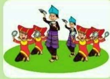
Tari Piring – Sumatra Barat