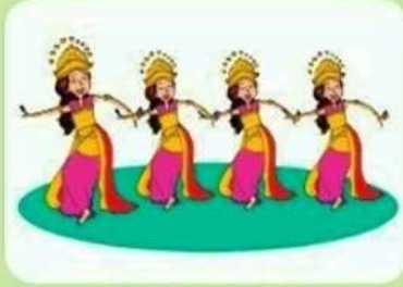
Tari Pendet – Bali