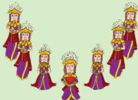
Tari Gending Sriwijaya, Sumatra Selatan

Penari berbaris membentuk garis menyudut ke kanan atau ke kiri.