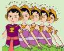
Tari Serimpi, Jawa Tengah