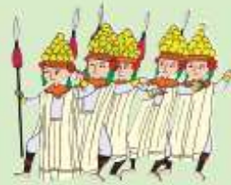
Tari Baris Cengkedan, Bali