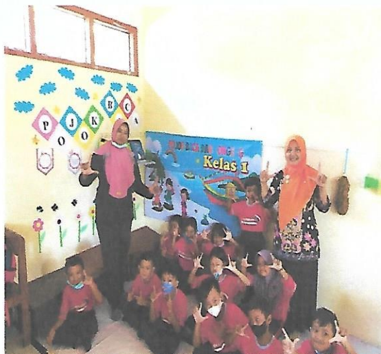
Foto Belajar Bersama