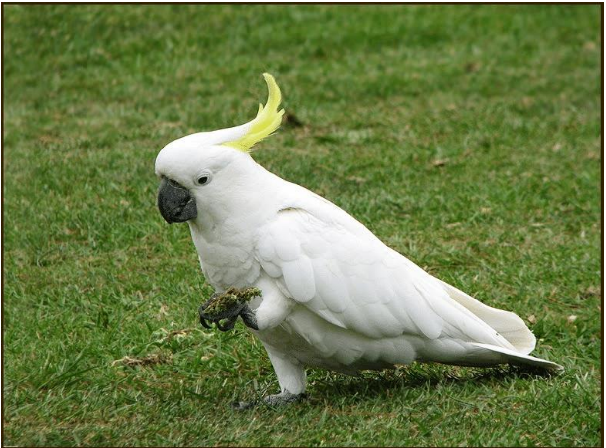
Gambar Burung Kakak Tua