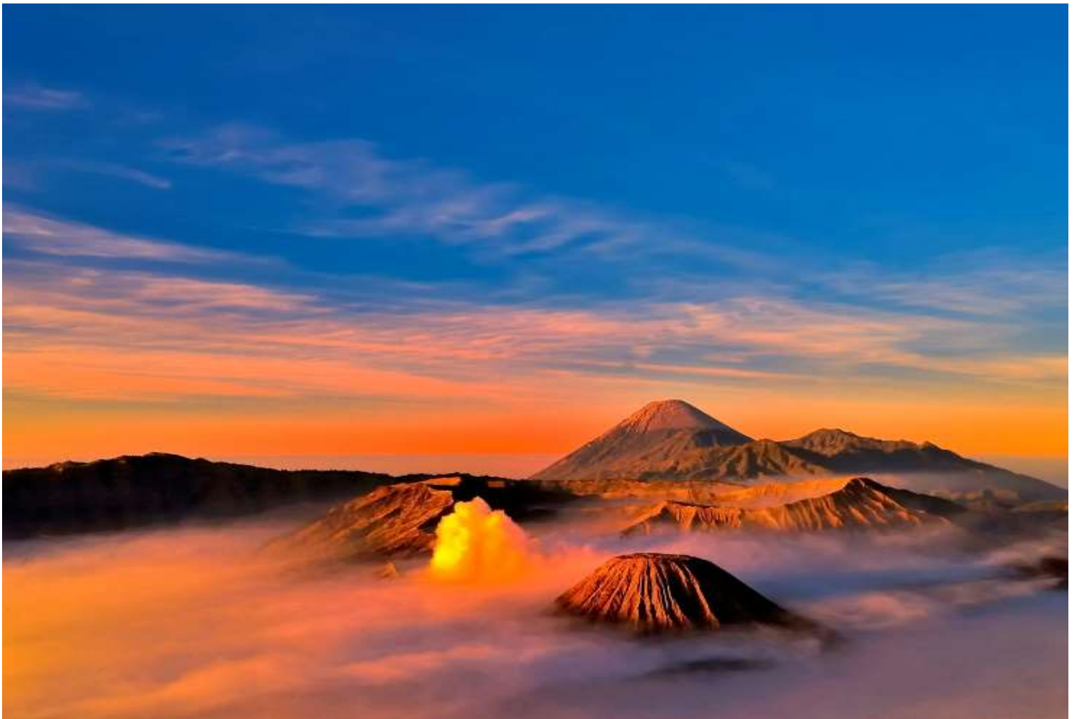
Gunung Bromo https://katalogwisata.com/keindahan-gunung-bromo-dan-wisata-indah-di-sekitarnya