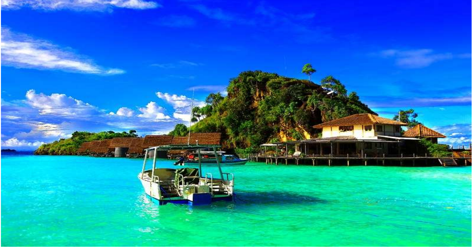
Gambar Raja Ampat

Anak- anak amatilah gambar pemandangan alam dibawah ini! Pernahkah kalian mengunjungi kedua tempat tersebut?