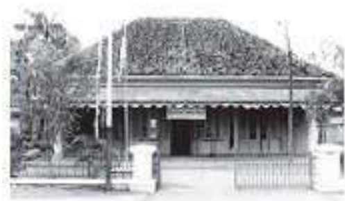
Wisma Indonesia, tempat Kongres Pemuda II

Kesadaran akan pentingnya persatuan dan kesatuan bangsa mendorong para pemuda dari berbagai suku bangsa yang ada di Indonesia untuk mengambil tindakan patriotisme. Situasi penjajahan Belanda yang diwarnai dengan larangan melakukan kegiatan organisasi, mendorong para