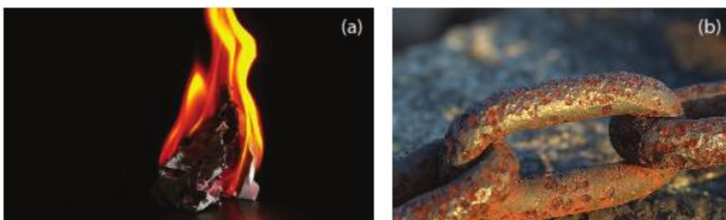
Gambar 2. Perubahan materi dapat berlangsung cepat dan lama

Perubahan kimia dapat terjadi karena beberapa proses yaitu :