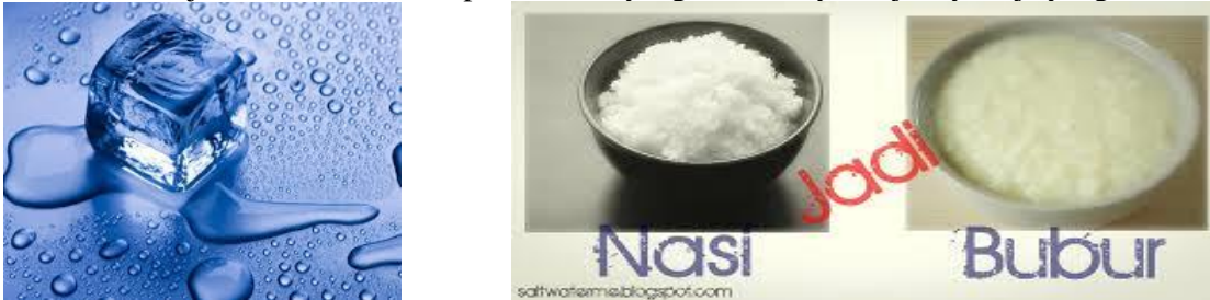
Gambar 1. Es mencair menjadi air (perubahan bentuk) dan nasi menjadi bubur

Contoh : jika air dipanaskan akan berubah menjadi uap air, sedangkan jika air didinginkan maka air akan membeku menjadi es. Es, air dan uap adalah zat yang sama hanya wujudnya saja yang berbeda.