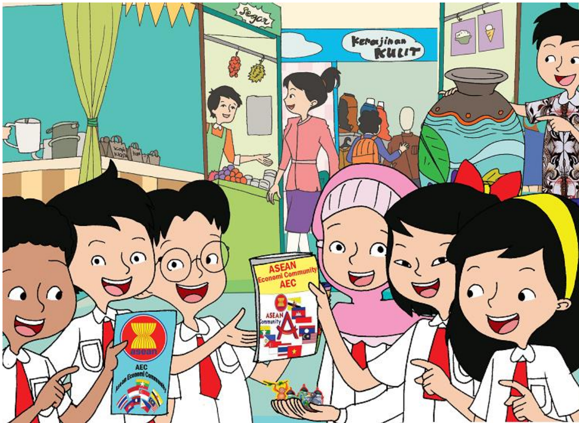
Meli Edo Beni Udin Lani Dayu Siti