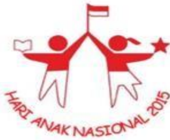
Logo Hari Anak