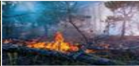
Gambar 2. Kebakaran Hutan

Kalian telah mempelajari potensi sumber daya hutan . Amatilah gambar 1 dan 2 serta carilah informasi tentang potensi sumber daya hutan lalu kerjakan tugas berikut dengan baik!