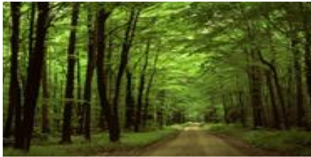
Gambar 1. Hutan