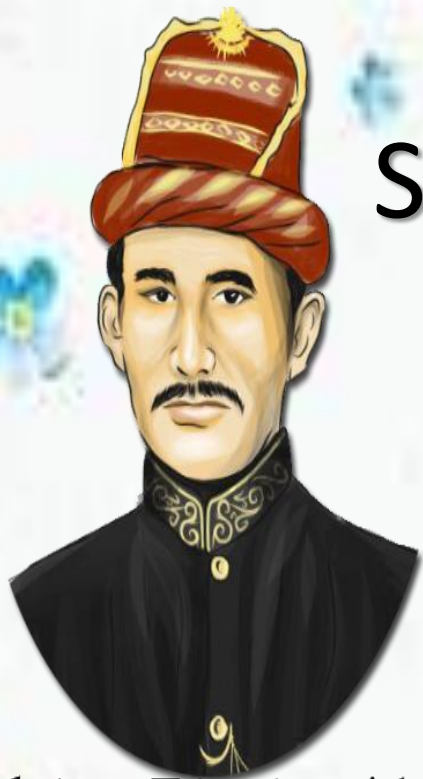
Sultan Iskandar Muda