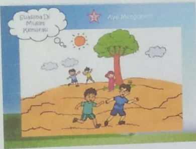
Gambar Suasana Musim kemarau