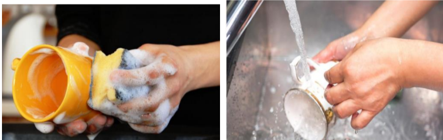
Cuci gelas gengan sabun

Ayo kita cuci gelas yang kita gunakan supaya bersih lagi