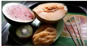
1. Siapkan alat dan bahan