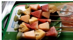
4. Sate buah sudah jadi