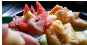
2. Kupas dan potong buah menjadi bentuk dadu dan segitiga