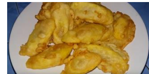
8. Pisang goreng siap dimakan