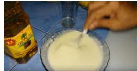
2. Buat adonan tepung