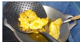
7. Angkat pisang goreng yang sudah matang tiriskan