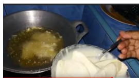
5 Masukkan pisang yang telah dilumuri adonan tepung kedalam minyak yang sudah panas. Siapkan alat dan bahan