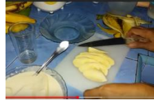
3. Kupas dan Iris Buah Pisang