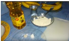
1. Siapkan alat dan bahan