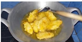
6. Balik pisang goreng agar tidak gosong