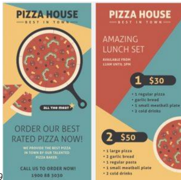
Soal Banner poster pamphlet 9