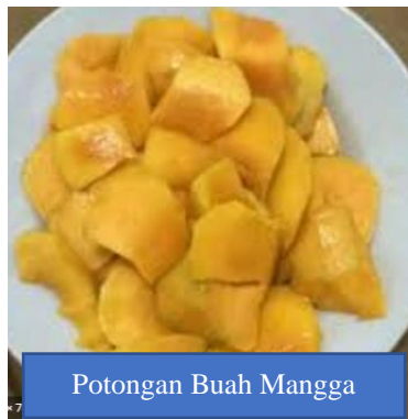
Potongan Buah Mangga