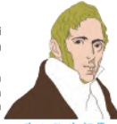
Thomas Stamford Raffles