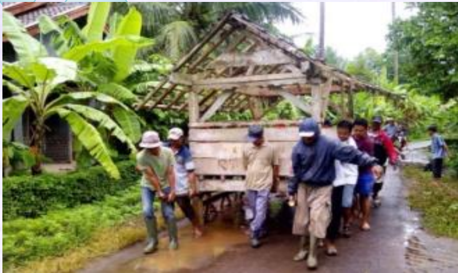
Gambar 2. Kegiatan gotong royong memindahkan pos keamanan