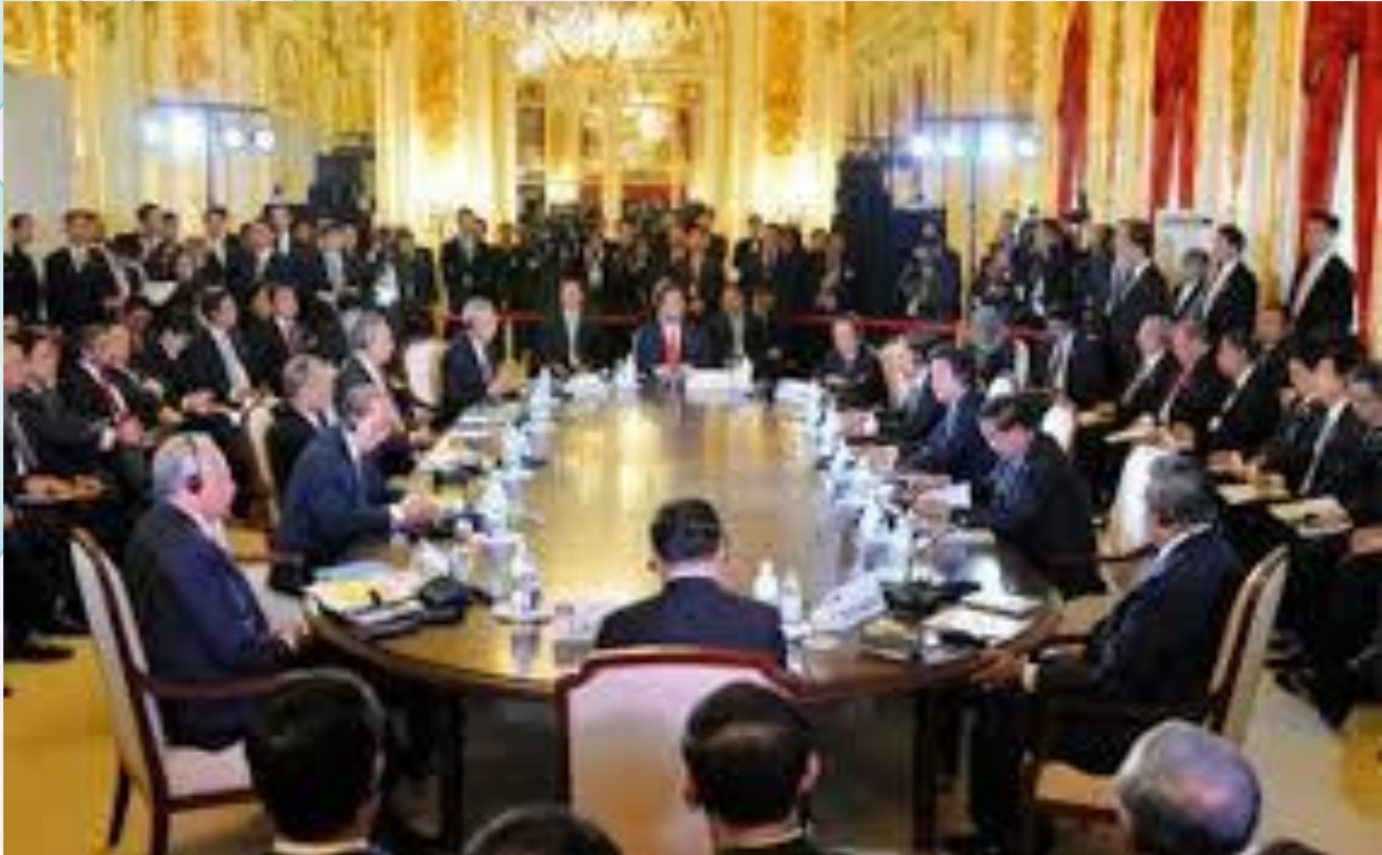
Gambar 1. Peringatan Kerja Sama 40 tahun ASEAN dan Jepang