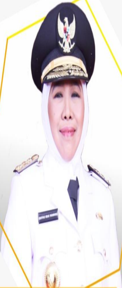
Dra. Hj. Khofifah Indar Parawansa, M.Si. Gubernur Jawa Timur Masa Bakti 2019 - 2024