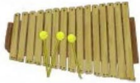
Gambar 4.8 Kolintang

Alat musik kolintang merupakan alat musik asli daerah Minahasa, Sulawesi Utara. Namakolintang menurut masyarakat Minahasa berasal dari suaranya, tong (nada rendah), ting (nada tinggi), dan tang (nada biasa). Dalam bahasa daerah setempat berarti, ajakan "Mari kita lakukan Tong Ting Tang" atau Mangemo kumolintang. Ajakan tersebut akhirnya berubah menjadi kata kolintang agar mudah dilafalkan oleh masyarakat.