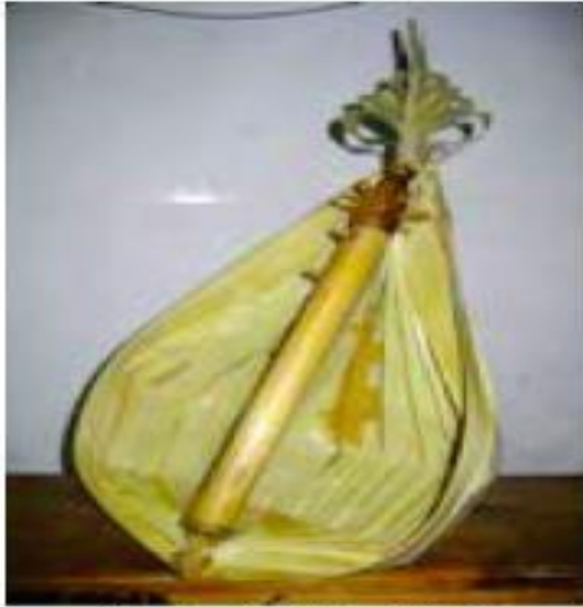
Gambar 4.6 Sasando