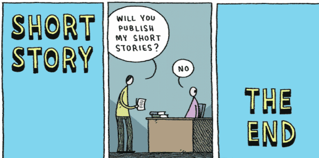
Gambar 9 comic strip