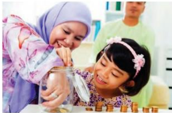
Interaksi antar individu, seorang ibu dengan anaknya