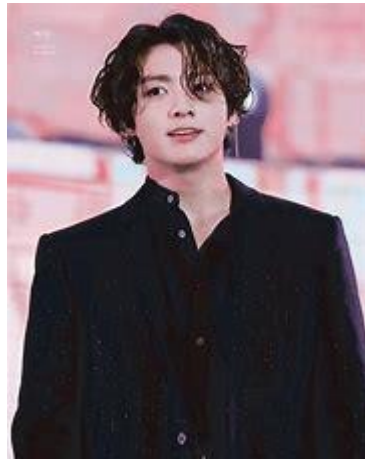
Jeon Jong Geok

Jungkook is the youngest member of the recent popular Korean boyband group member BTS. His birthname is Jeon Jung Kook. Today he wants to be called JK. He was born on September 1th, 1997 in Busan, South Korea. He is the Main Vocalist, Lead Dancer, Sub Rapper, Center/ Face of the Group.