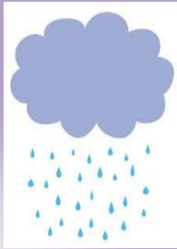
Air hujan (tawar)