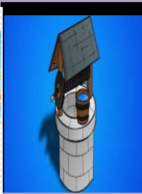
Air Sumur (tawar)