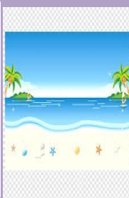
Air Laut (asin)