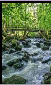
Air sungai (tawar)