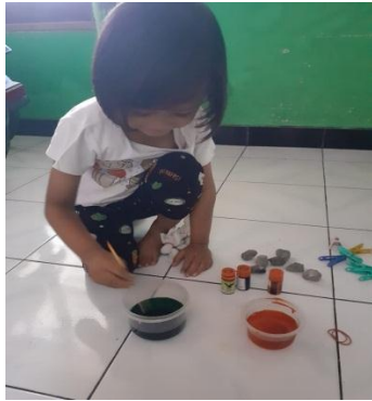
5. Anak mencelupkan ikatan-ikatan pada warna yang mereka inginkan