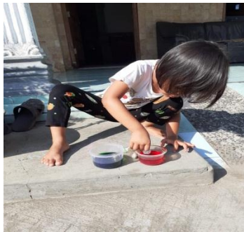
6. Anak melepas ikatan-ikatan batu kerikil