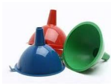
Corong plastic, sarung tangan dan botol spray