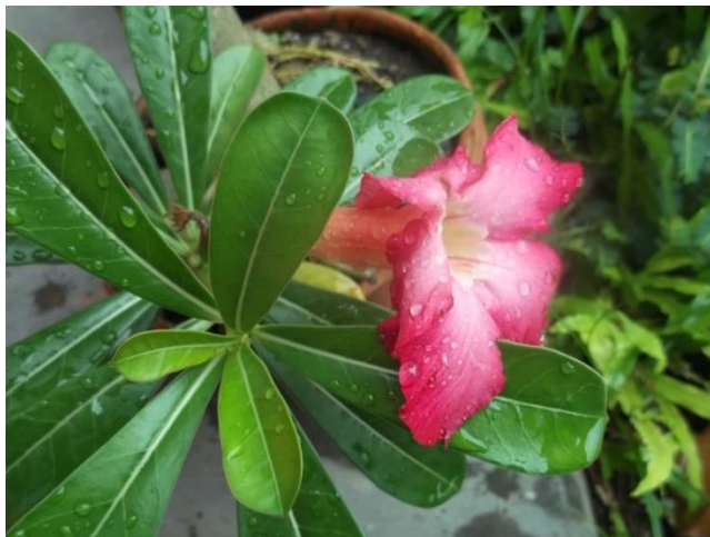
Daun dan Bunga