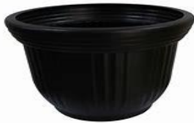
POT BUNGA 70