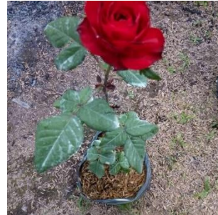
Pohon bunga mawar