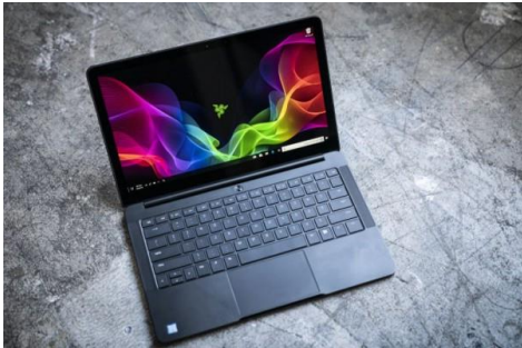
Laptop (video youtube)

A. ( https://drive.google.com/file/d/1_e95cliSulrOJUiDnB-BMvdQKsKO3-b/view?usp=drivesdk ) ----- video alat dan bahan ajar-----