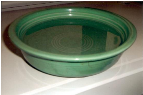
Baskom berisi air