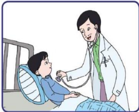
Dokter memeriksa pasien

Jasa adalah segala aktivitas atau manfaat yang ditawarkan kepada orang lain (konsumen). Meskipun tidak menghasilkan barang seperti misalnya industri konfeksi menghasilkan pakaian. Usaha jasa memberikan pelayanan kepada konsumen. Contoh pekerjaan yang menjual jasa adalah guru, pengacara, dokter, montir mobil, jasa keuangan, pemandu wisata, dan sebagainya.