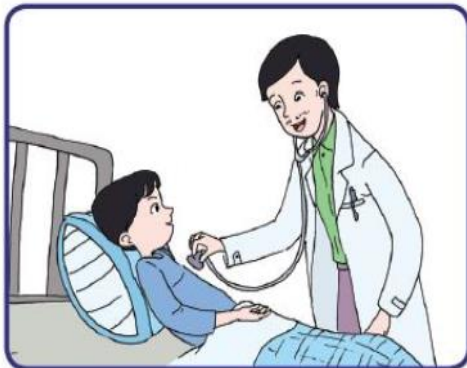
Dokter memeriksa pasien

Jasa adalah segala aktivitas atau manfaat yang ditawarkan kepada orang lain (konsumen). Meskipun tidak menghasilkan barang seperti misalnya industri konfeksi menghasilkan pakaian. Usaha jasa memberikan pelayanan kepada konsumen. Contoh pekerjaan yang menjual jasa adalah guru, pengacara, dokter, montir mobil, jasa keuangan, pemandu wisata, dan sebagainya.