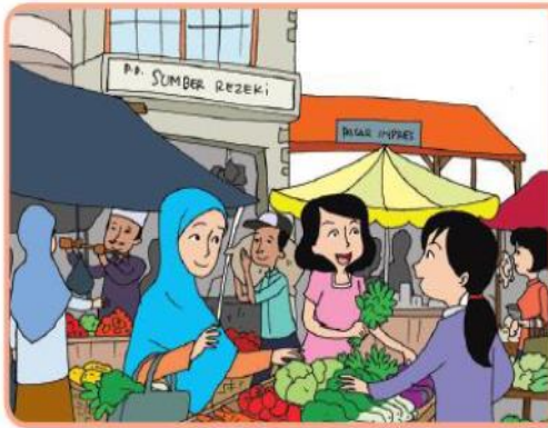
Kegiatan jual beli di pasar