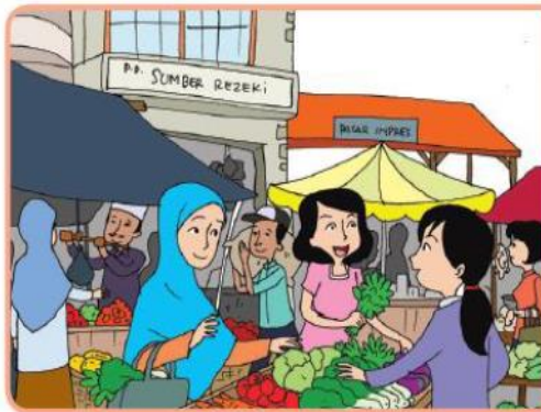
Kegiatan jual beli di pasar