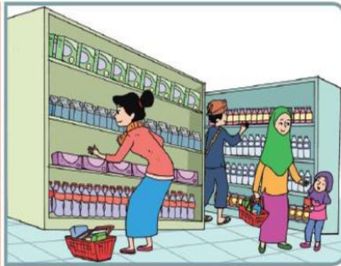
Orang belanja di toko swalayan